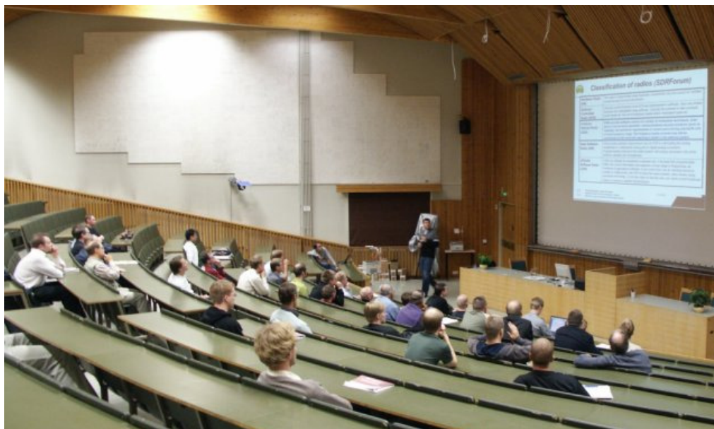
Kuva B1: Kuvateksti, jossa on liitteen numerointi

Liitteissä voi myös olla kuvia, jotka eivät sovi leipätekstin joukkoon: Liitteiden taulu-