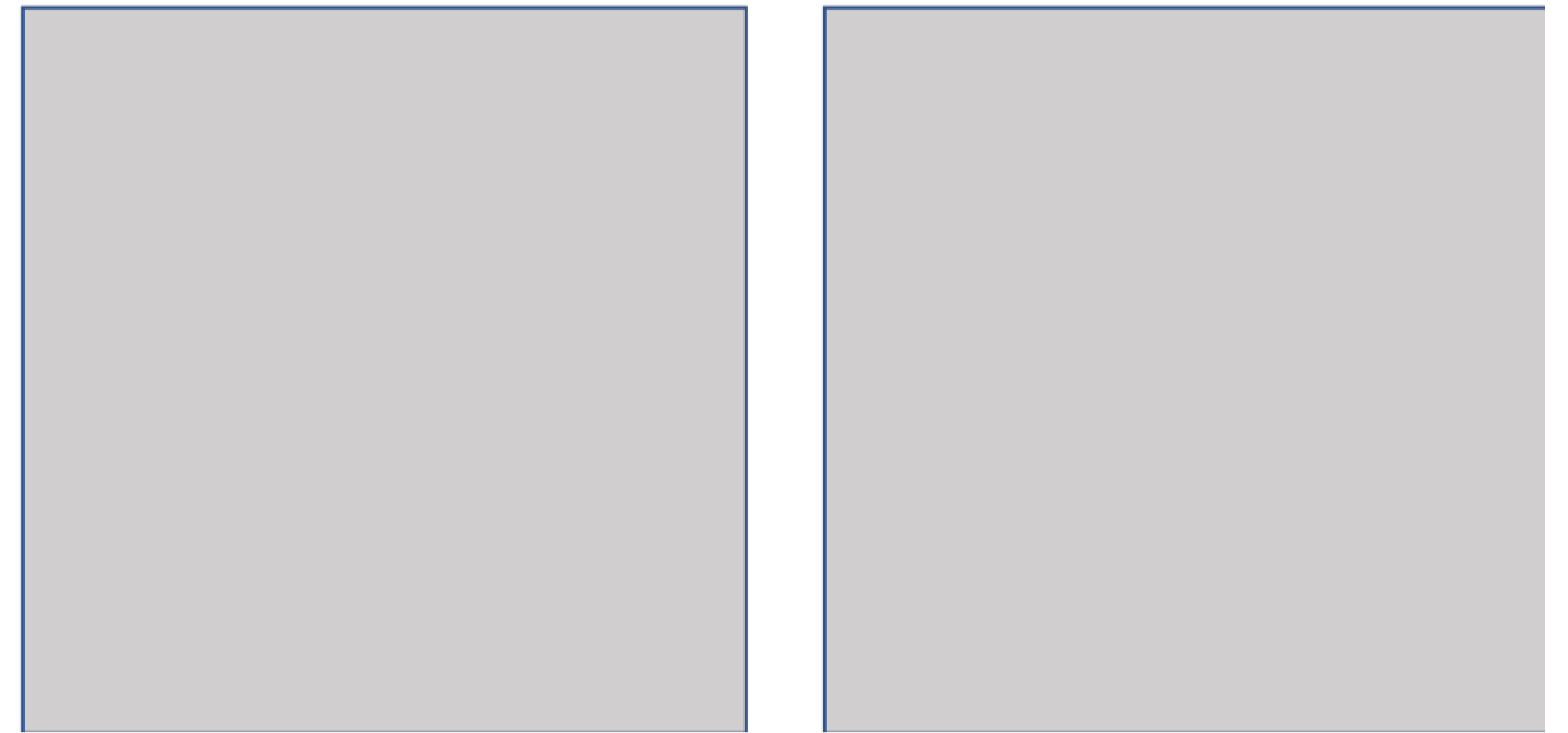
Figure 2: Caption for figure Two.